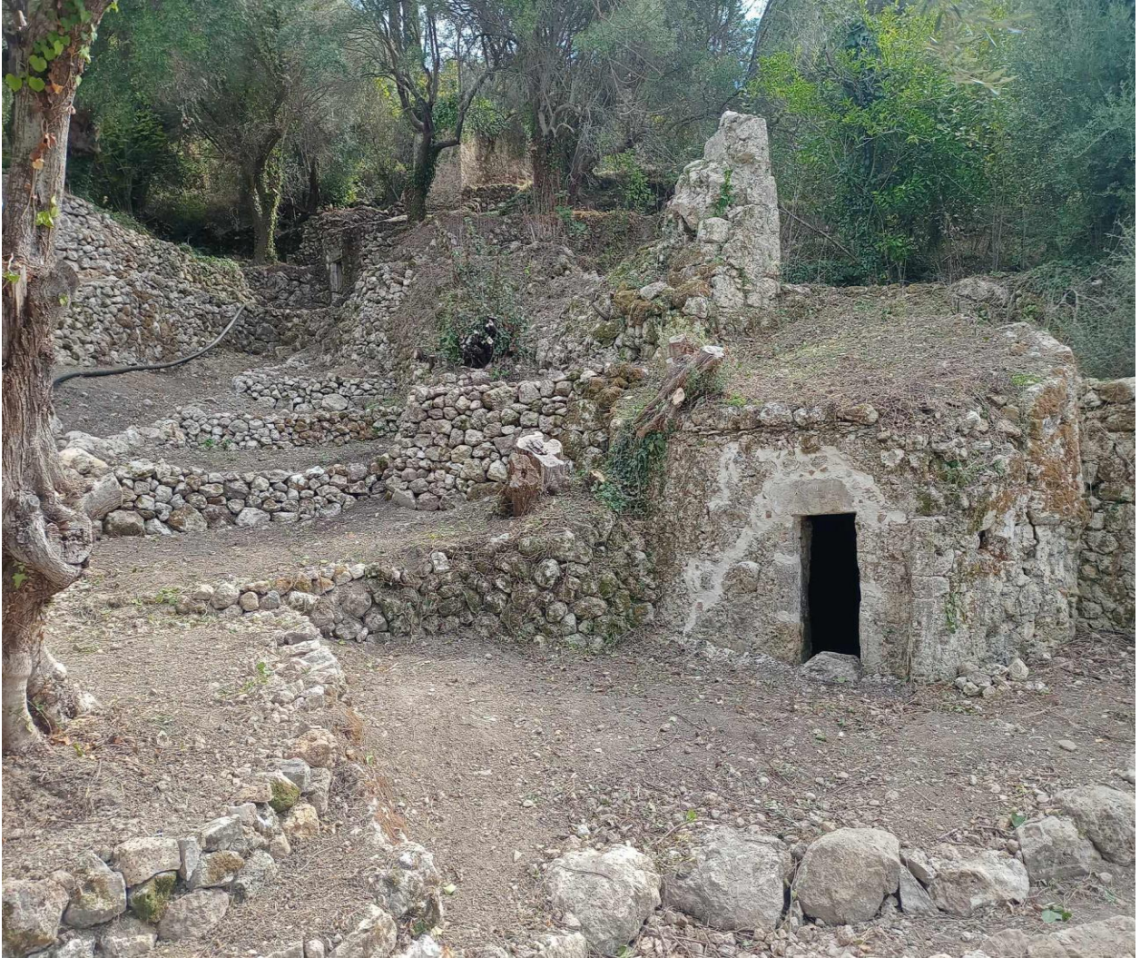
Νερόμυλος Καλαμιτσιού (Καλαμιτσιώτικα ΝΕΑ ο Νερόμυλος)

Οι πράξεις ακολουθούν την σειρά που είναι γραμμένες στο αρχικό βιβλίο