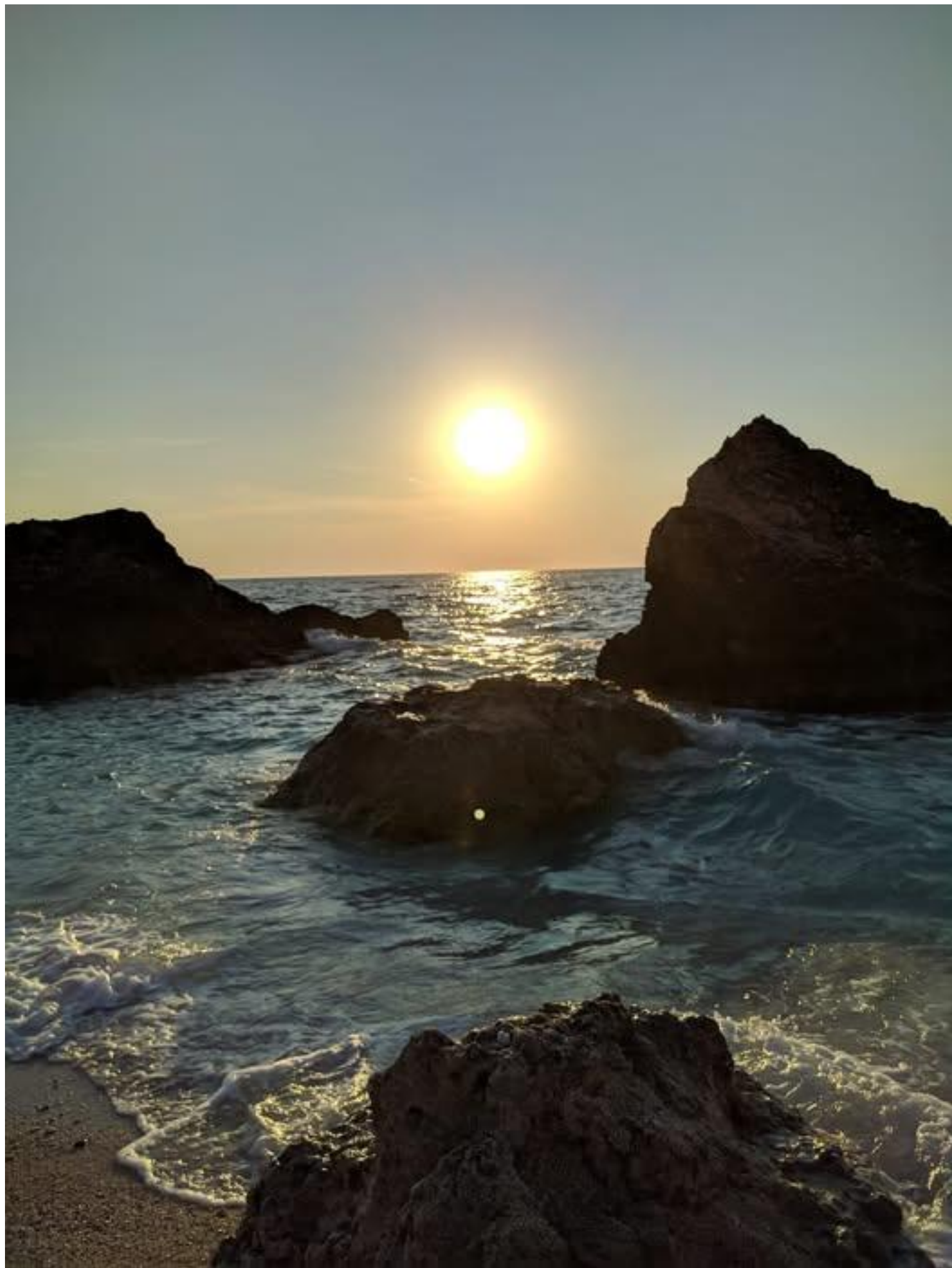
Lefkada Photos - Φωτογραφίες της Λευκάδας