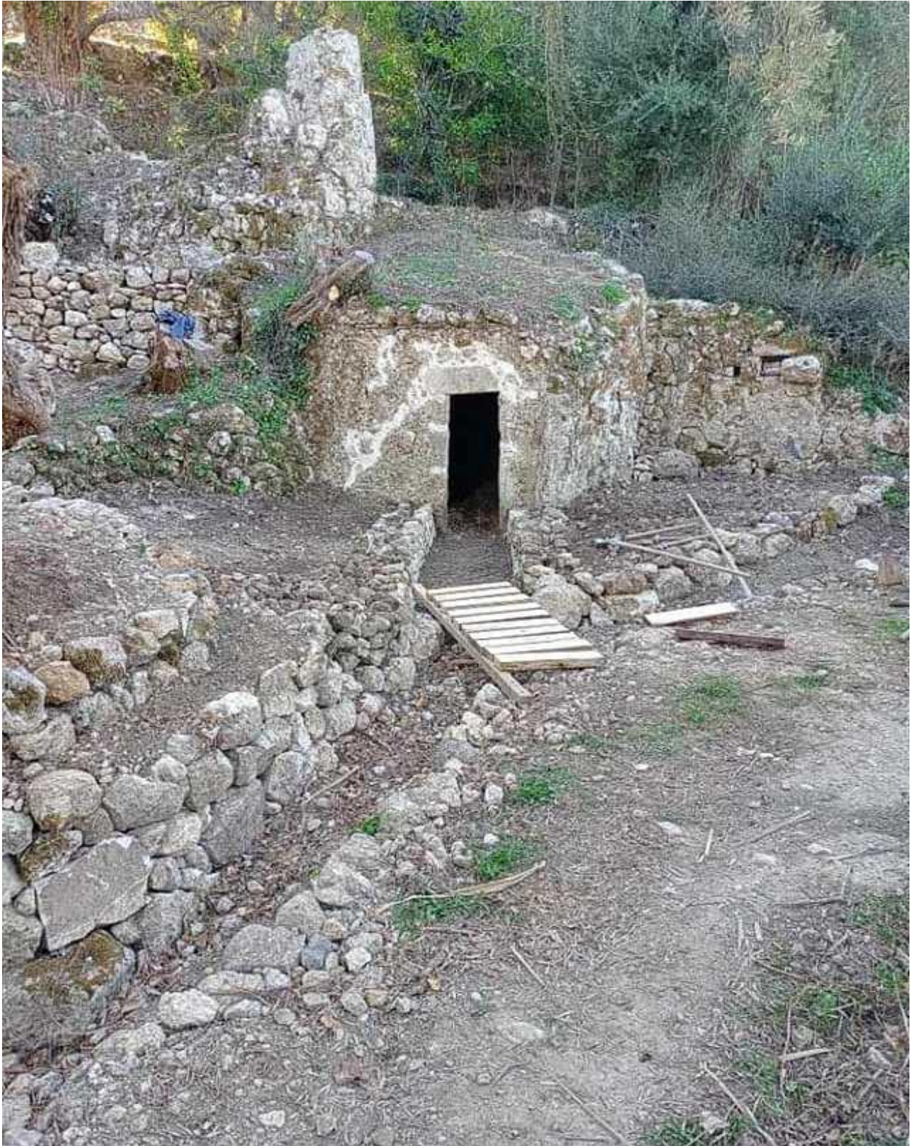
Νερόμυλος Καλαμιτσιού (Καλαμιτσιώτικα ΝΕΑ ο Νερόμυλος)