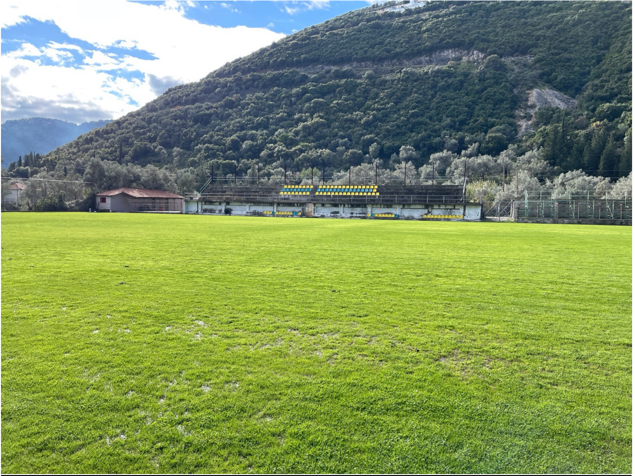
ΕΙΚΟΝΑ 2. ΕΥΡΥΤΕΡΗ ΠΕΡΙΟΧΗ ΓΗΠΕΔΟΥ