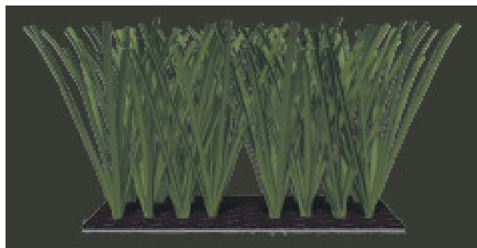
Ενδεικτική εικόνα τρόπου πλέξης

Ο τρόπος πλέξης τους δεν θα είναι ο κλασικός (straighttufted), όπου οι ίνες τοποθετούνται μία προς μία στο υπόστρωμα σε μια προκαθορισμένη απόσταση μεταξύ τους, αλλά με την μέθοδο πχ ύφανσης (woven), δεσμών (bundle), ζιγκ ζαγκ (zig-zag), Matrix, κλπ.