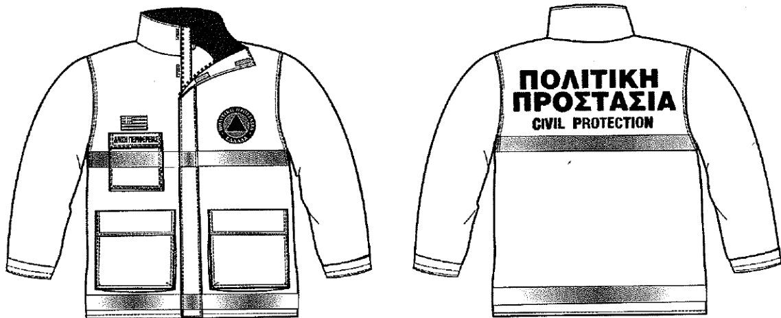
Εικόνα 1. Επιχειρησιακά μπουφάν Πολιτικής Προστασίας

Σύμφωνα με το 4678/22-11-2004 έγγραφο ΓΓΠΠ, τα επιχειρησιακά μπουφάν Πολιτικής Προστασίας θα πρέπει να έχουν την ακόλουθη μορφή: